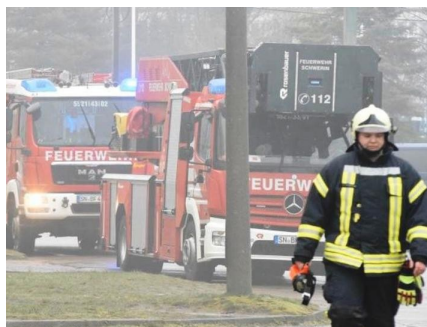
Rauch empfing uns schon bei der Ankunft