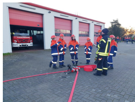
Arbeiten am Verteiler

Auch die Abnahme der Jugendflamme II wurde auf nächstes Jahr verschoben.