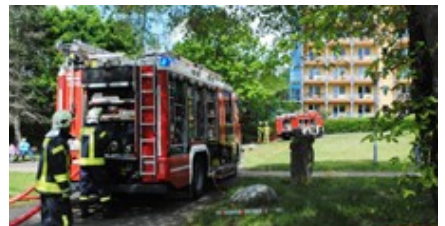
Wohnungsbrand in Zippendorf

Die Bewohnerin wurde mit Verdacht auf Rauchgasvergiftung in das Klinikum verbracht.