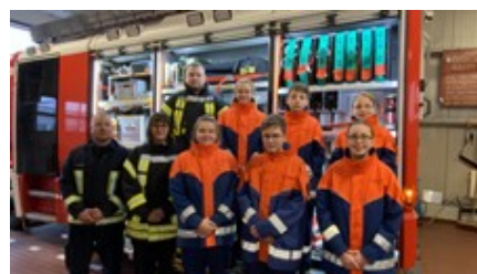
Der neugewählte Jugendausschuss

Wir hoffen dass es nach den Sommerferien wieder weitergeht und freuen uns schon darauf.